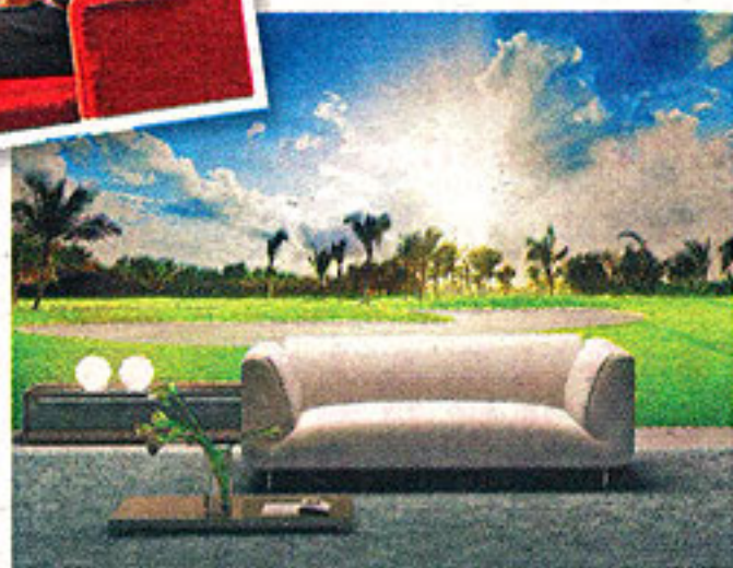
▲數碼印刷服務方便客人自訂牆畫圖案，並採國英國Muraspec膠面纖維牆布，訂貨期為確認初稿後約3至4星期。