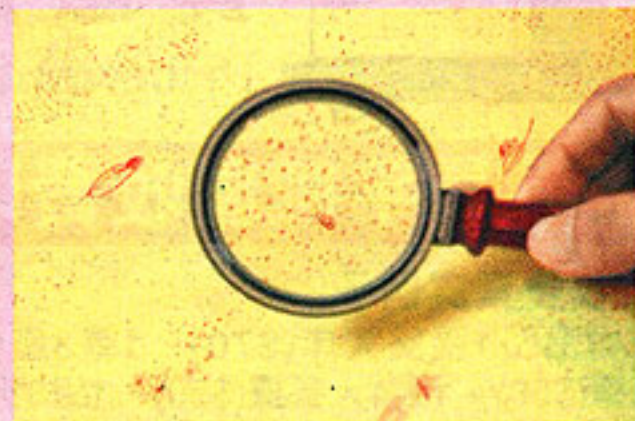
▲Mercedes Cuetos設計的昆蟲世界牆畫附送放大鏡。