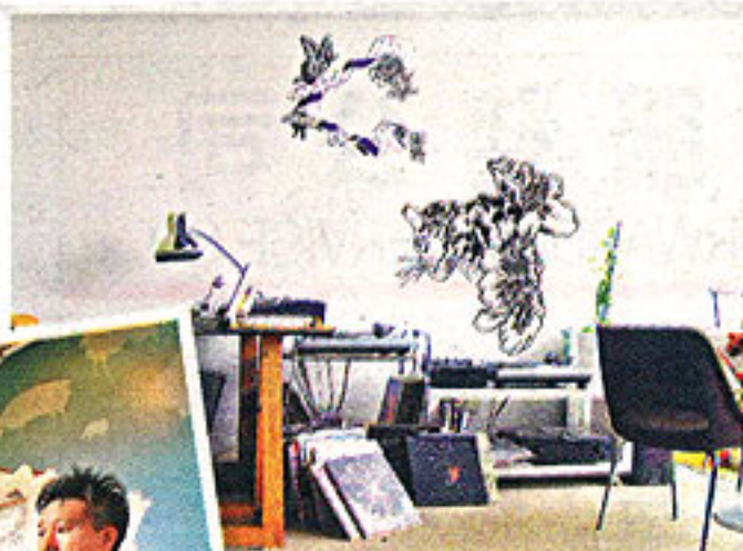
▲這款牆畫名為《Voice of the Forest》，來自西班牙Tres Tintas的Art Gallery系列。