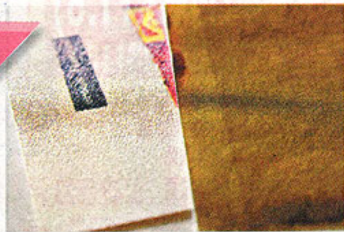
▲牆畫採用non-woven纖維物料，表面以不同暗紋處理，主要視乎個別品牌。